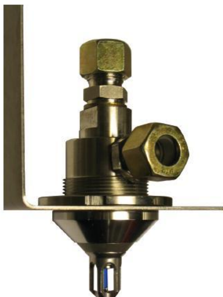
Patentovaná tryska ULTRA FOG s detekční skleněnou baňkou