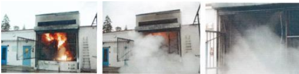
Simulovaný požár trafostanice – doba hašení 45 sekund

Pro ochranu technologických stanic a vlastní technologie před požárem lze použít automatické protipožární zařízení typ - systém s tlakovými lahvemi. Tento systém není závislý na přívodu elektrické energie a je cenově výhodný pro ošetření menších prostorů.